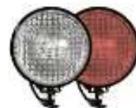
фары на СИМ